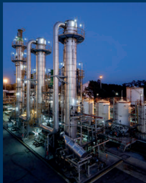
Bondalti / Grupo José de Mello