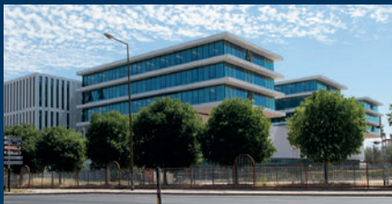
Hospital CUF Tejo / Grupo José de Mello