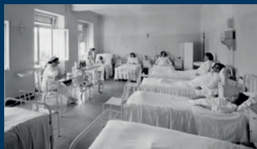
Hospital CUF, Lisboa