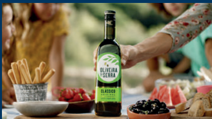
Azeite Oliveira da Serra / Grupo Sovena