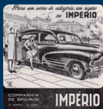
Comp. de Seguros Império