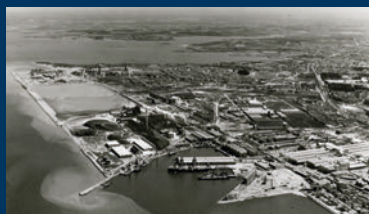
Complexo Industrial CUF, Barreiro