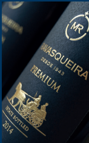
Monte da Ravasqueira / Grupo José de Mello