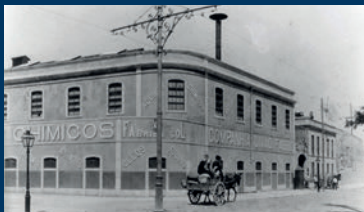
Fábrica Sol, Lisboa