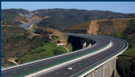
Brisa - Autoestradas de Portugal / Grupo José de Mello