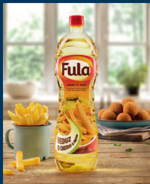
Óleo Fula / Grupo Sovena