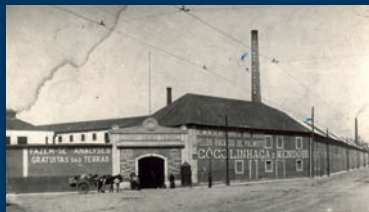
Companhia União Fabril, Lisboa